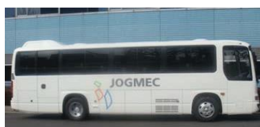
TRC 中型バス (定員44名)

※お帰りのバス (TRC 発—幕張本郷駅行のみ) の時刻表は、館内の案内掲示をご覧ください。