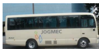
TRC 小型バス (定員28名)