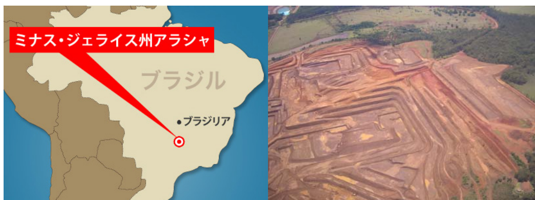
【CBMM 社ニオブ鉱山の所在地、および、同鉱山の全景】

新日本製鉄株式会社、JFE スチール株式会社、双日株式会社、独立行政法人石油天然ガス・金属鉱物資源機構（以下、JOGMEC）と、韓国の手製鉄企業の POSCO 社および NPS 社（韓国国民年金基金）の日韓連合は、高級鋼材の生産に不可欠なレアメタル（希少金属）であるニオブの鉱山企業であるブラジルのカンパニア・ブラジレイラ・メタルジア・イ・ミネラソン社（Companhia Brasileira de Metalurgia e Mineração、本社：サンパウロ市、以下、CBMM）と、同社の株式の 15%を取得することで合意しました。新興国を中心に高級鋼材の需要が伸びる中、ニオブの世界生産量のトップシェアを占める CBMM 社に出資することで、ニオブの安定調達体制を整えます。