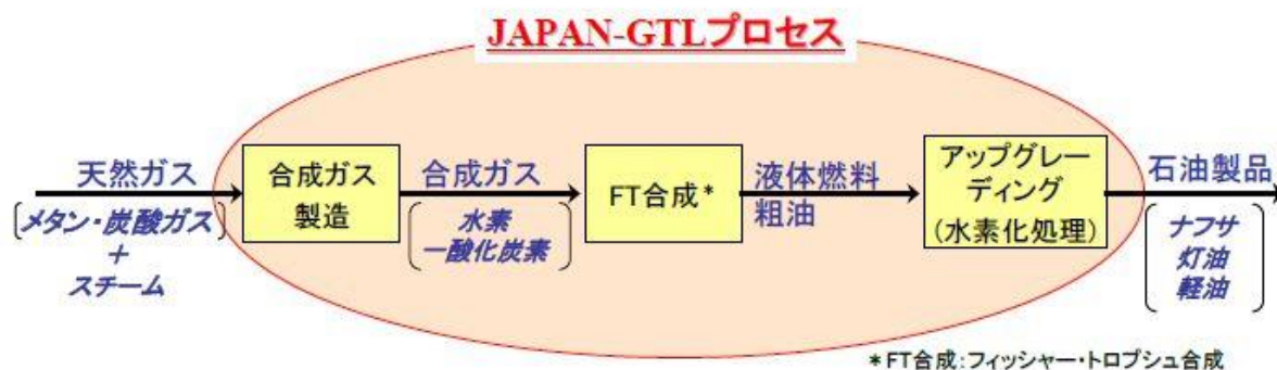
図2 JAPAN-GTL プロセスの製造フロー

GTLとは、天然ガスから、化学反応によってナフサ、灯油、軽油等の石油製品を製造する技術のことです。JAPAN-GTL プロセスは、天然ガス中に含まれる二酸化炭素(CO 2 )を原料としてそのまま利用することが可能な世界初の画期的な技術であるため、放出するCO 2 を減らし環境負荷を軽減します。世界に広く賦存する天然ガス、シェールガス等から、硫黄分及び芳香族を含んでいないクリーンなナフサ・灯油等の石油製品を製造することが出来るようになり、新たな液体燃料資源確保の道を開くとともに、エネルギー安全保障に貢献する技術です。