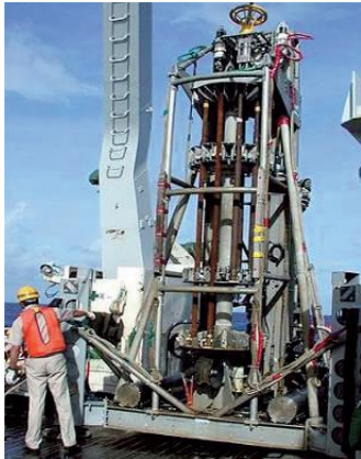
海底着座型掘削装置(BMS)

海底を掘削するボーリングには、2種類の海底着座型掘削装置(BMS)と船上設置型掘削装置(R140)があります。