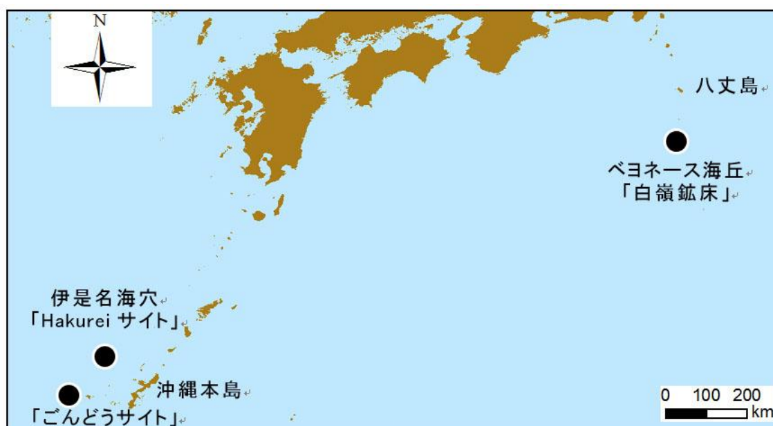
海底熱水鉱床「Hakureiサイト」、「白嶺鉱床」および「ごんどうサイト」位置図

平成27年1月に発見を公表した沖縄海域久米島西方沖の「ごんどうサイト」では、ボーリング調査により下部へ鉱床が連続することを確認しました。今後、引き続き調査を行い、資源量評価を行います。