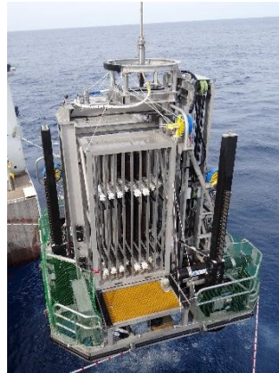
海底着座型掘削装置(BMS)