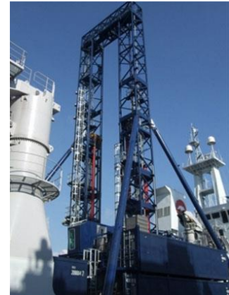
船上設置型掘削装置(R140)