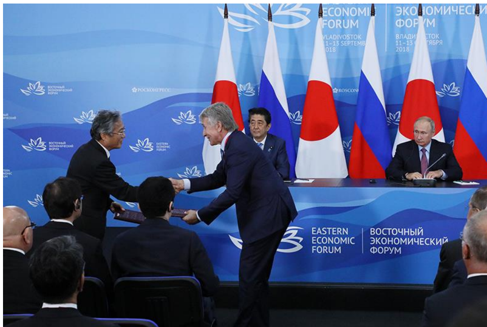
日露首脳会談文書交換式