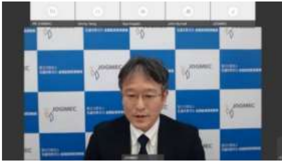
JOGMEC 中村地熱事業部長による開会挨拶