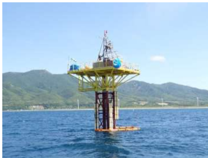
令和5年度 海底地盤調査サイト(鋼製檣によるボーリング)

(URL) https://www.meti.go.jp/press/2021/10/20211022005/20211022005.html